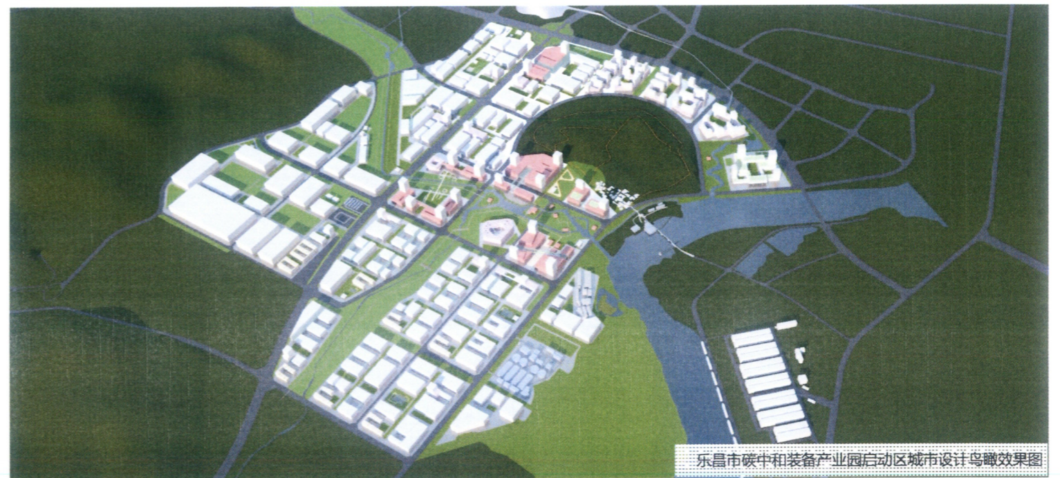
乐昌市碳中和装备产业园启动区城市设计鸟瞰效果图