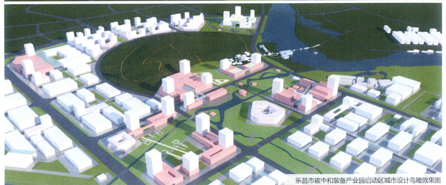
乐昌市碳中和装备产业园启动区城市设计鸟瞰效果图